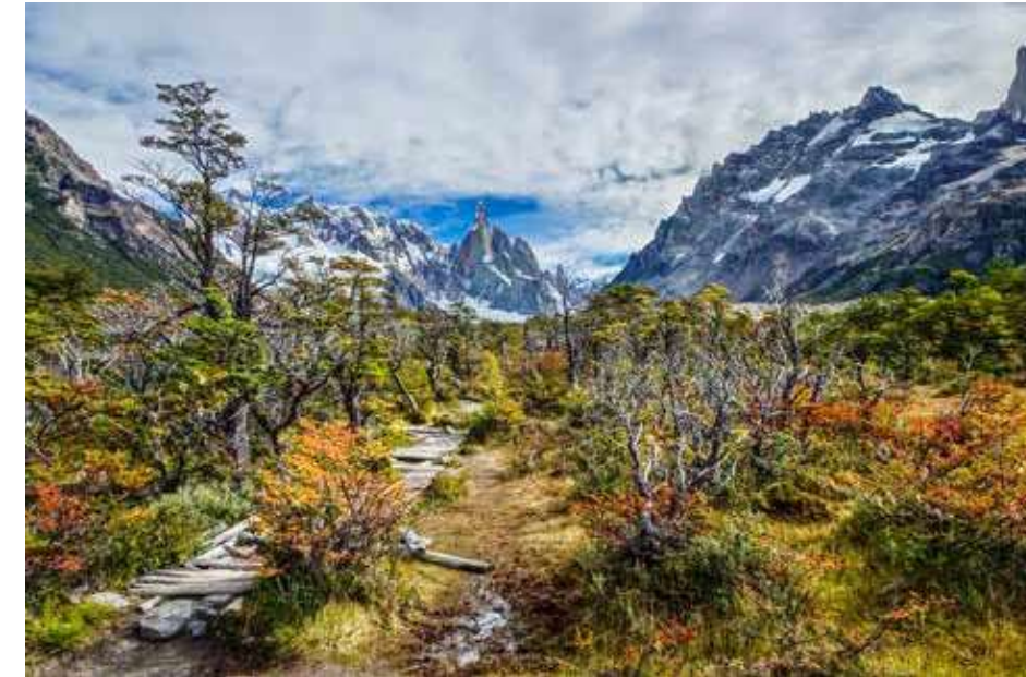
Sony DSC-WX500 | 24 mm | 1/400 s | f 4,5 | ISO 80

ALPIN-Redakteure Robert Demmel und Andreas Erkens. Der Foto-Upload auf alpin.de ist ab dem 1. April geschaltet.